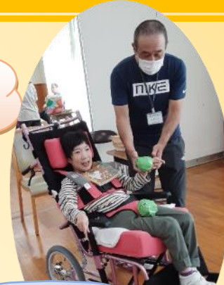
ポッチャコーナー