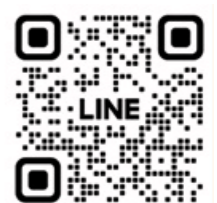
障害者福祉センター公式LINE