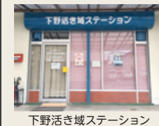
下野活き域ステーション