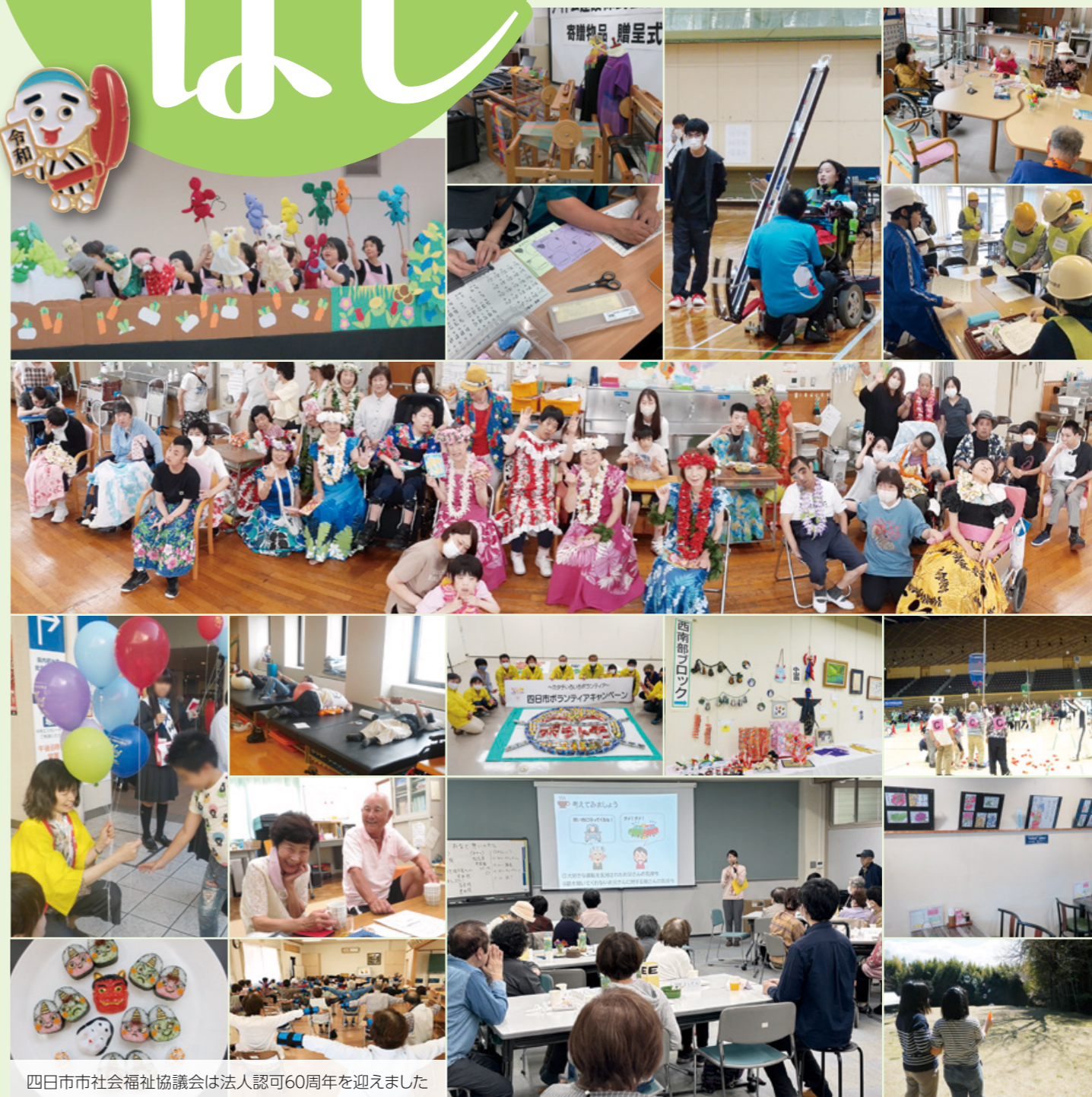
四日市市社会福祉協議会は法人認可60周年を迎えました