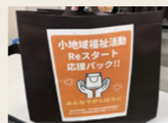
小地域福祉活動Reスタート応援パック