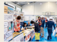
災害VC地域アドバイザー市民総ぐるみ訓練啓発ブース