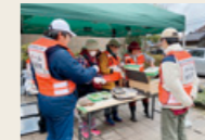
チーム四日市能登