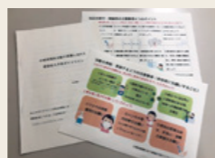
感染症拡大予防ガイドライン