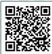
▲紹介ページはこちら

障害者福祉センターでは、身体障害者の自立と社会参加を促進するため、デイサービス事業を行っています。興味のある人は、気軽にお問い合わせください。