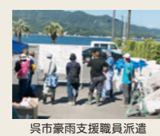
呉市豪雨支援職員派遣