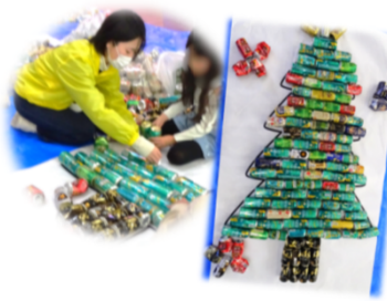
アルミ缶アートづくり

世代や障害の有無を 問わず、皆で楽しめる ユニバーサルスポーツ。 ルールや道具について 説明し、実際に競技を 体験しました。