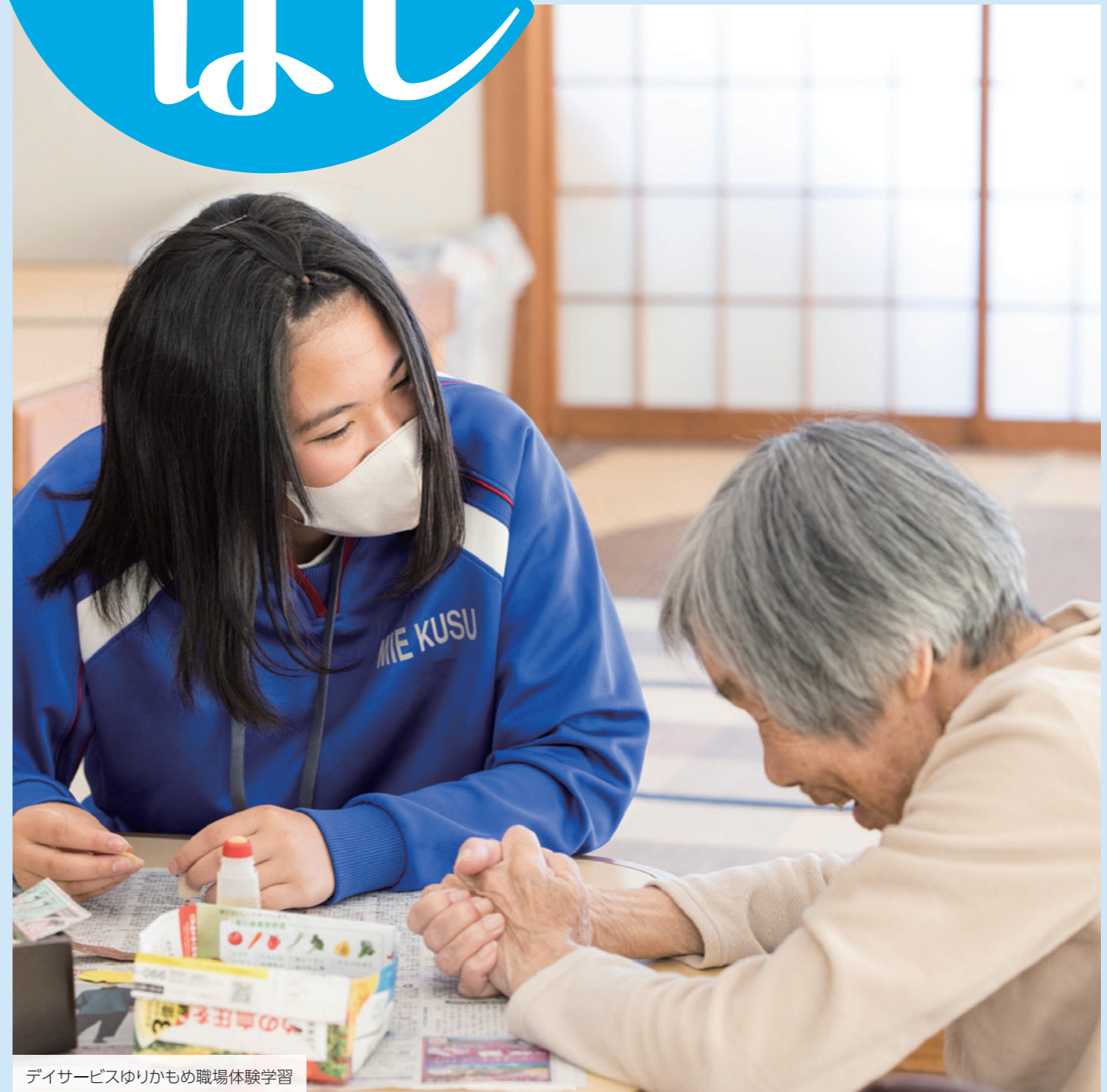
デイサービスゆりかもめ職場体験学習