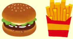
昼食：モスバーガーの ハンバーガー&ポテト