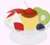
プリンアラモード (プリンは市販品)