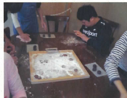
[栗きんとん&お饅頭作り☆]

○翌日は、きりら坂下で、「栗きんとん」と「お饅頭」を作って、お土産として持ち帰りました。