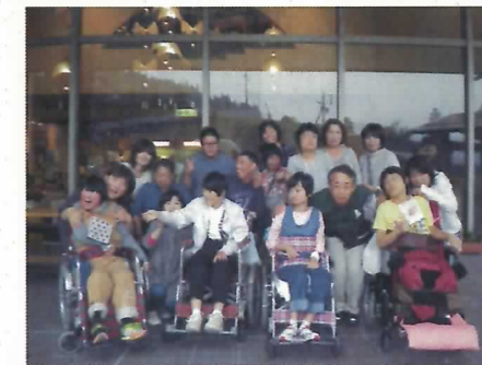
[ホテルの前で記念撮影♪]

○翌日は、きりら坂下で、「栗きんとん」と「お饅頭」を作って、お土産として持ち帰りました。