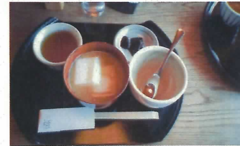
[和菓子をいただきます☆]

○今回は、岐阜県の中津川の「ホテル花更紗」に泊まりました。到着した後、周辺を車で散策したり、クアリゾートの温浴を楽しんだりしました。