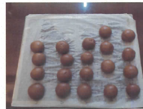
[お饅頭の出来上がり♪]