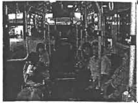
ノンステップバスの中からパチリ！

春から夏にかけては緑がまぶしいお花見シーズンですね。3グループでは、季節に合わせて5/30(金)に「なばなの里」へ行ってきました。たんぼぼの中でも、♪乗り物大好き♪のアクティブ嗜好なメンバーが揃ったグループなので、お花を楽しむだけではなく、公共交通機関を利用しての日帰り旅行となりました。