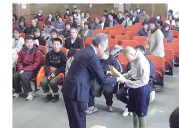
平成25年12月20日 市総合会館にて