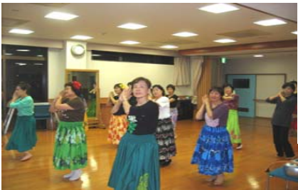
フラダンスの練習中の写真です。